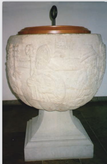
Taufstein der Pfarrkirche