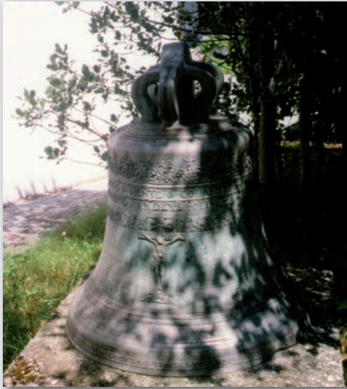
Glocke (1639) vor der Agathakapelle