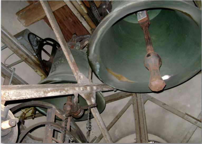
Glockenstuhl der Pfarrkirche St. Blasius