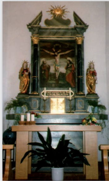
Hochaltar der Agathakapelle